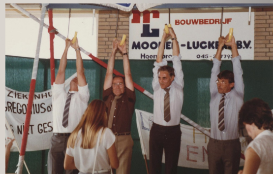
Parapluhangen tijdens de rommelmarkt

Het lijkt misschien een beetje een simplistisch verhaal, maar het tekent een tijdsbeeld waarin met een cent en een stuiver veel geregeld moest worden.